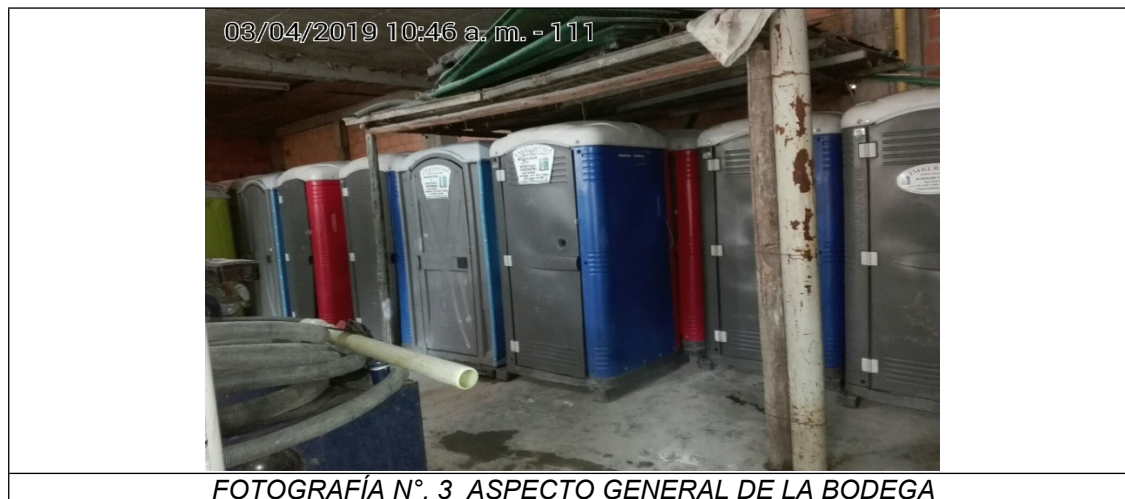
FOTOGRAFÍA N° 3 ASPECTO GENERAL DE LA BODEGA