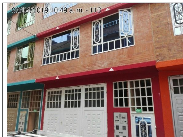
FOTOGRAFÍA N°. 1 FACHADA DEL PREDIO.